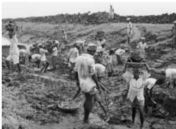
Excavación del canal.

La disputa se empeoró cuando uno de los lugareños, que quería que el camino fuera desviado, entregó notificaciones legales las cuales detuvieron la excavación del canal y la construcción del camino. La noticia se supo rápidamente en toda la aldea y más de 300 familias se enfurecieron. Se juntaron y decidieron desobedecer la orden de la corte y terminar ellos mismos el trabajo para beneficio de todos los lugareños. También decidieron