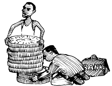
... mais 30% de cette somme est alloué au service de la dette