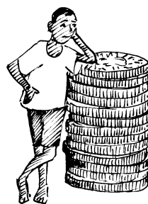
Seulement 15% du PNB récolté en taxes...